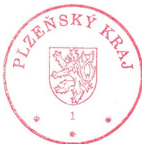
MUDr. Petr Zimmermann hejtman Plzeňského kraje

Přílohy - č.1 - soupis movitého a nemovitého majetku - č. 2 – okruhy doplňkové činnosti